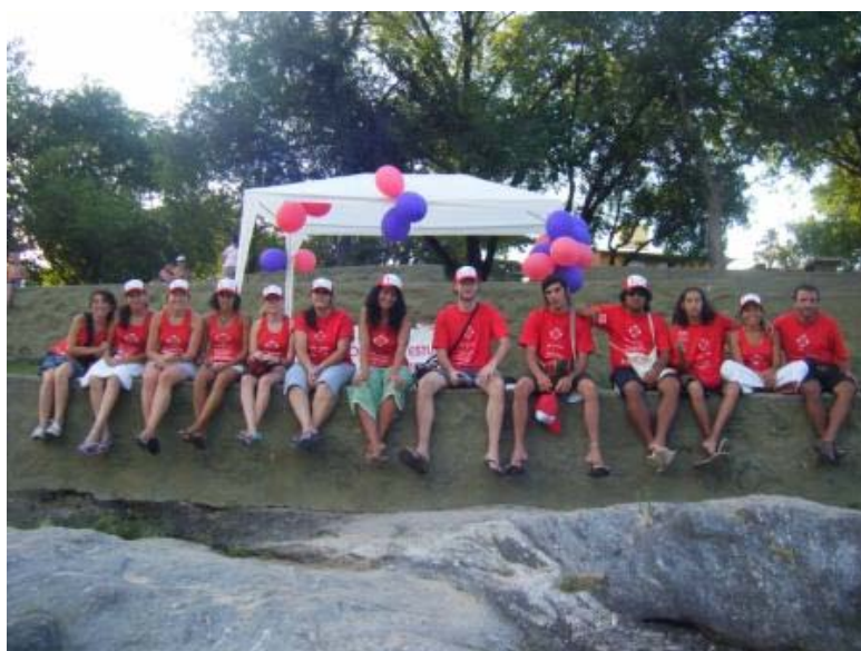
La -RedNac- reúne a 21 organizaciones y grupos de 12 provincias.

Numerosos programas de prevención para jóvenes y adolescentes son implementados por personas adultas, sin incorporar las perspectivas y necesidades específicas de este grupo poblacional. Las acciones de la RedNac son planificadas y realizadas por jóvenes hacia otros jóvenes, aprovechando los códigos comunes de la comunicación entre pares, y reconociendo las realidades de la juventud en cada localidad. Además, la RedNac estimula especialmente la participación juvenil, con el objetivo de contribuir a la formación de nuevos líderes comunitarios y educadores de pares; y favorecer que la juventud ejerza más plenamente su ciudadanía.