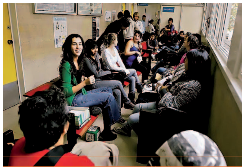
Taller sobre salud sexual en sala de espera del hospital Argericht

El Programa de Salud Integral en la Adolescencia, tiene por meta aumentar el acceso y la utilización de los servicios de salud por parte de las y los adolescentes. Para ello promueve y difunde el derecho a acceder al sistema de salud en forma autónoma, sin obligación de acompañamiento de un mayor y en el marco del respeto a la confidencialidad.